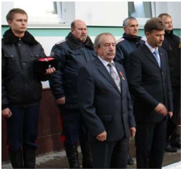
Казаки и члены Имперского Союза-Ордена