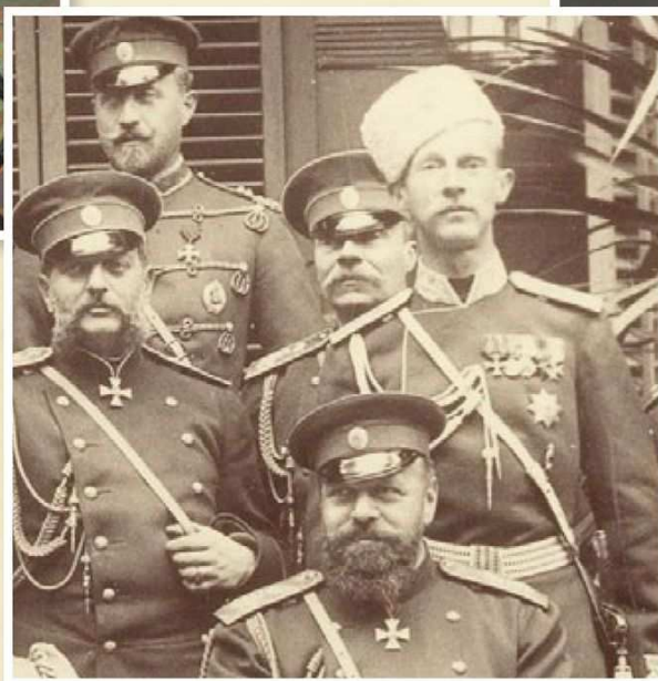
С Государем Императором Александром III (внизу). Во втором ряду справа – Великий Князь Димитрий Константинович. Слева – брат Государя Великий Князь Владимир Александрович, прадед нынешней Главы Российского Императорского Дома Её Императорского Высочества Великой Княгини Марии Владимировны.