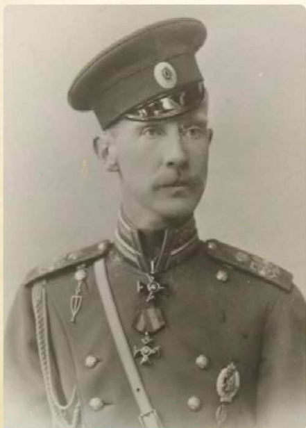
Фото 1895 г.

Конечно же, сам факт прибытия представителя Августейшей Семьи в то время явился грандиозным событием, позволившим жителям саранской провинции по-настоящему ощутить себя частью Великой России. Ведь город посетил внук Государя Императора Николая I и двоюродный брат Государя Императора Александра III. Его жизнь – воплощенный пример служения Богу, Царю и Отечеству, жизнь истинного христианина.