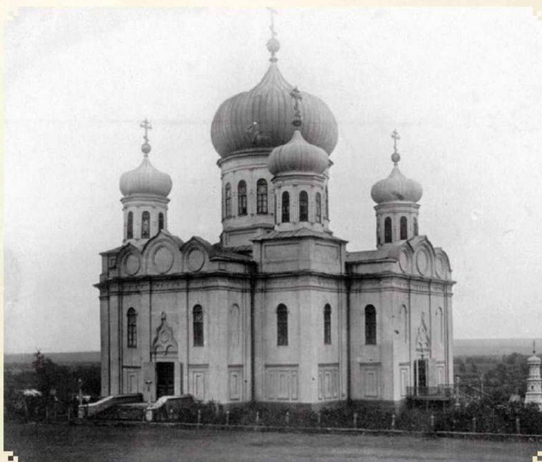
Спасский собор в г. Саранске. Разрушен в 1930 г.